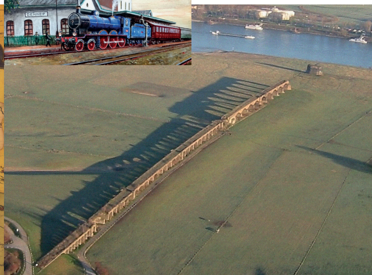
Ruïne van de Rijnbrug Wesel