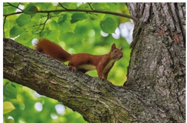
“Eichhörnchen in Astgabel” von Sigrid Kuczniery , 2. Preis Deutschland.