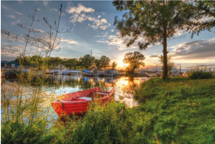
“Rode boot bij zonsondergang” van Gertjan van Soest , 1 e prijs Nederland.