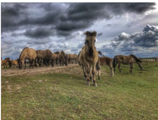
“Overstekende Koninkpaarden” van Michael Makaaij , 2e prijs Nederland.