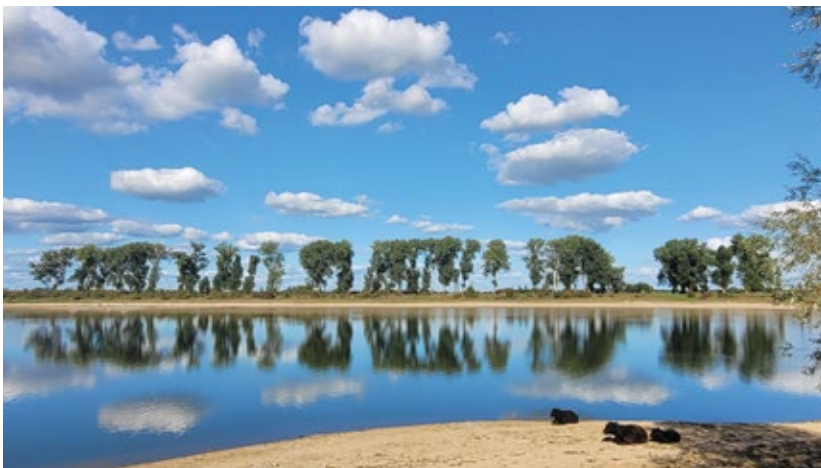
“Die Ruhe” von Carsten Bräutigam , 1. Preis Deutschland.