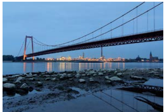
Thomas Arntz - Blaue Stunde